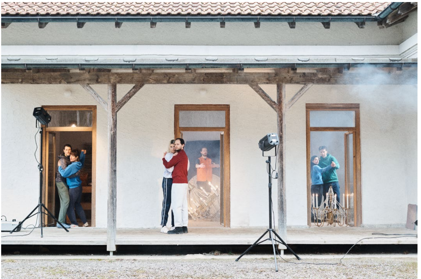
Probekbilder: Grafische Praxis, Laurenz Feinig